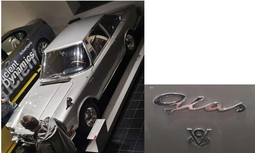
Design von Frua - einem italienischen Edeldesigner – gebaut rund 700 Stück

gestiegen ist, weil sich die Jugend das in den Kopf gesetzt hatte? Für mich persönlich das Highlight der Ausstellung ist der Glas V8 – das schönste Auto ever! Aber nicht zu vergessen ist der BMW-Teil des Museums. Die dokumentierten Entwicklungsschritte der Produktionsstätte sind imposant und toll dargestellt.