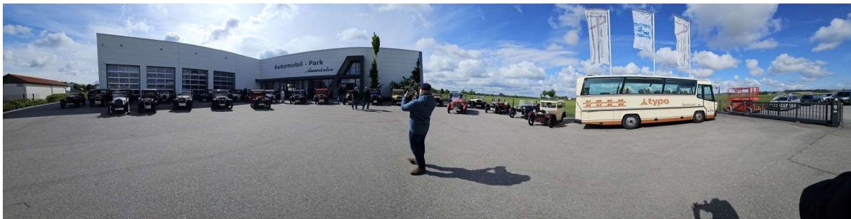
Konferenzbus Bj.1977 – gebaut für McDonalds